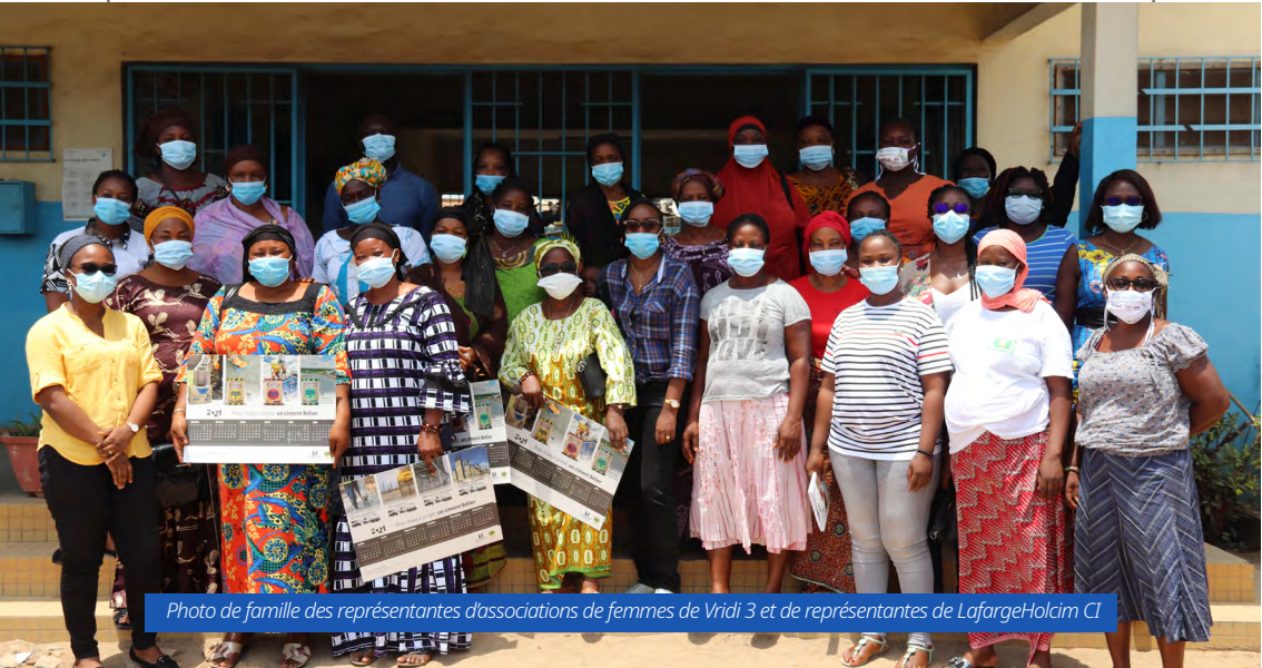
Photo de famille des représentantes d'associations de femmes de Vridi 3 et de représentantes de LafargeHolcim CI