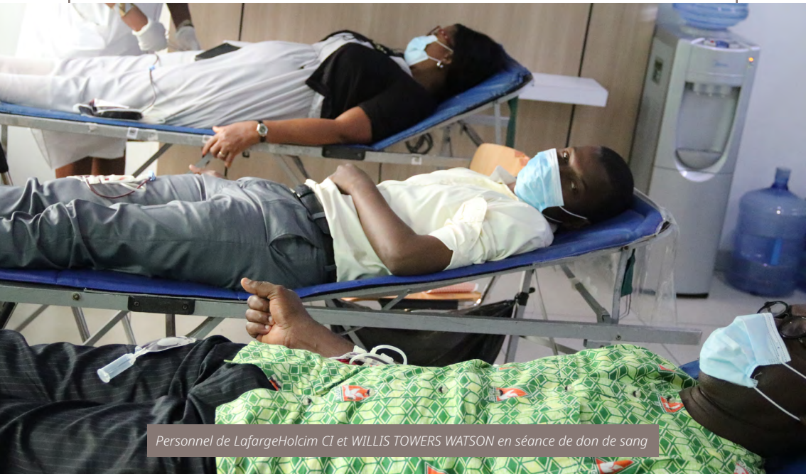
Personnel de LafargeHolcim CI et WILLIS TOWERS WATSON en séance de don de sang