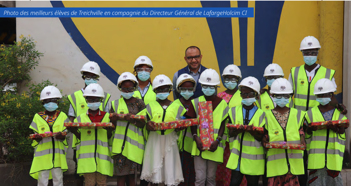
Photo des meilleurs élèves de Treichville en compagnie du Directeur Général de LafargeHolcim CI