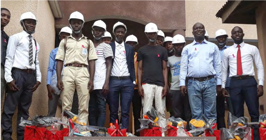
Photo des jeunes apprenants recevant leurs Kits d'insertion professionnelle