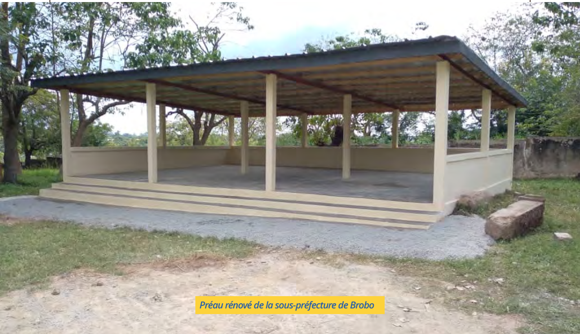
Préau rénové de la sous-préfecture de Brobo