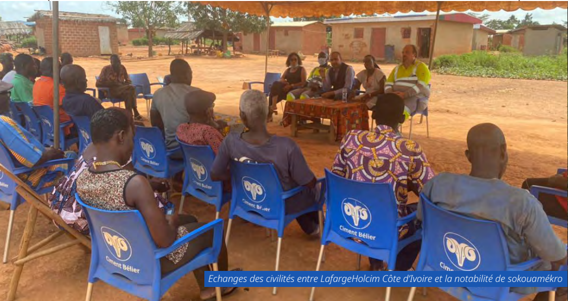
Echanges des civilités entre LafargeHolcim Côte d'Ivoire et la notabilité de sokouamékro