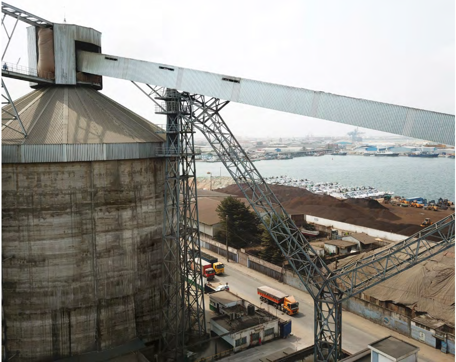
Photo du Silo Clinker