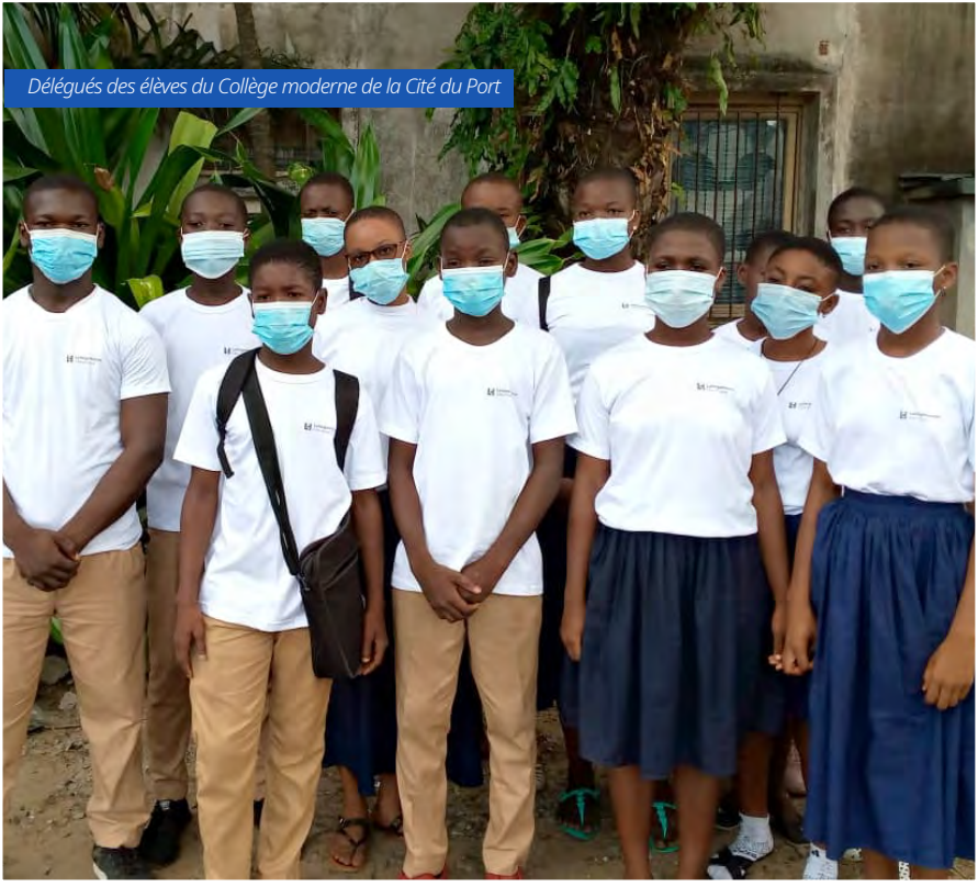
Délégués des élèves du Collège moderne de la Cité du Port