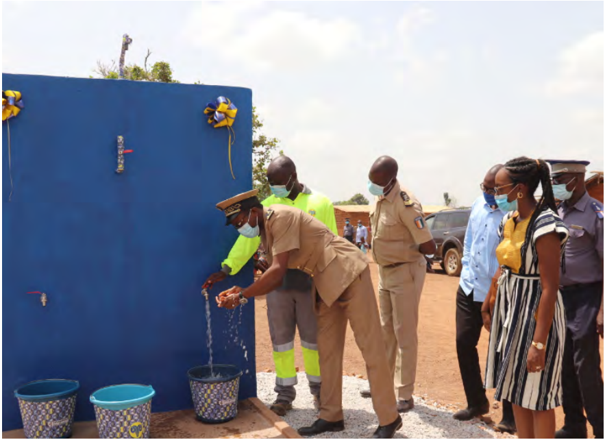
Inauguration officielle du forage de Sokouamékro en présence des autorités administratives et du Directeur du Cluster Afrique de l'Ouest du groupe Holcim